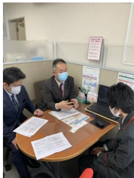
【横浜ベイサイド支部】