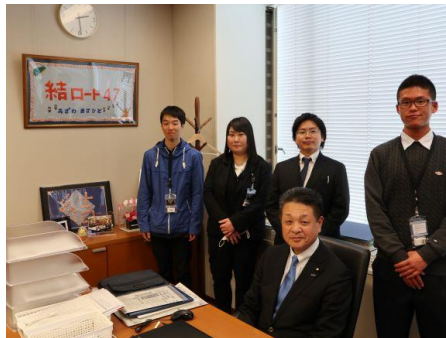
【小沢まさひと参議院議員国会事務所にて】