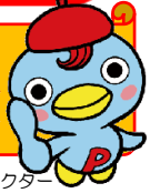
JP労組広報キャラクター はッピーくん

賃金や労働条件等は、すべてJP労組が会社と交渉して決定しています。 全国24万人の仲間と、働きがいのある会社づくりに参加しましょう!