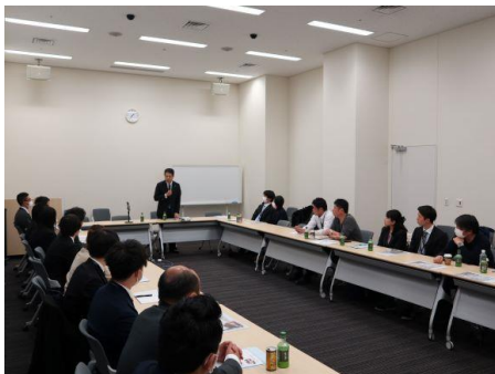
【会議室で小沢議員による政治学習会】