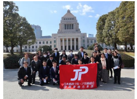
【国会議事堂前で参加者と】

私たちの郵政グループは政治と不可分の関係であることから、国会見学を通じ組合員の政治意識醸成を目的に取り組んでいます。今後も国会見学等を通じ政治が身近に感じる取り組みを進めていきますので、組合員の皆さんの参加をお待ちしています。