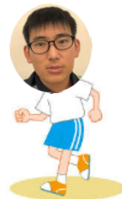
曾我ユース事務局長

みなさんの活動により、多くの仲間がJP労組に加入しました! 仲間の声を大切に、みんなで楽しい職場づくりを実践しましょう。